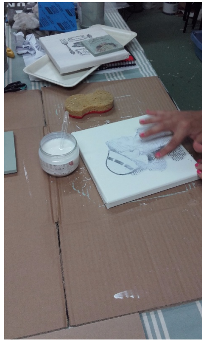
Atelier " faux bois"