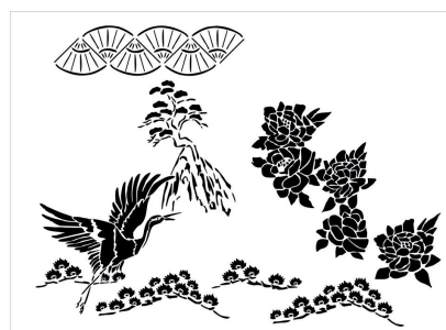
Pochoir Ming, thème japonisant Prix: 31,50 euros

Papier peint à lé unique: 48 x 250 : 45 euros