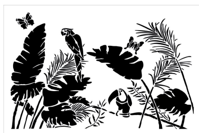
Pochoir Toucan, thème jungle Prix: 31,50 euros