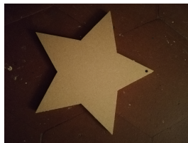
Etoile en médium épaisseur 1cm, taille 18 cm, 2 euros

Des supports et bois ainsi que des pochoirs sont en vente à l'atelier .