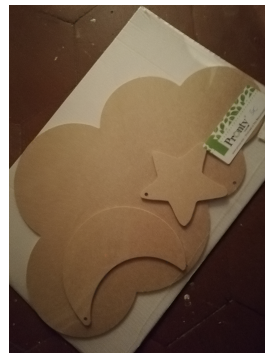
Kit mobile en médium, 3 euros