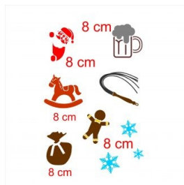
Pochoir sujets Noël : 18 euros