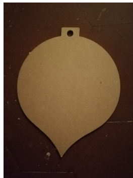
Boule en médium fin, taille 14 cm: 1 euros, taille 22 cm:2 euros