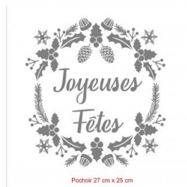
Pochoir Couronne : 25 euros